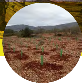
Restauración forestal y creación de sumidero forestal Dos Aguas, València