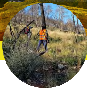
Bosque Eurofred Artana, Castellón